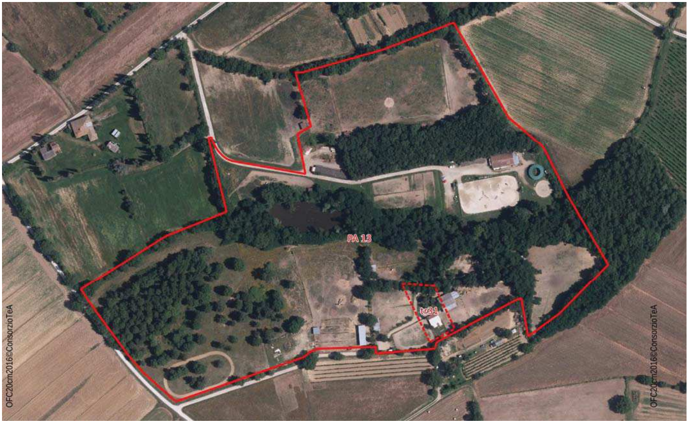
Ortofoto 2016 (Volo AGEA)