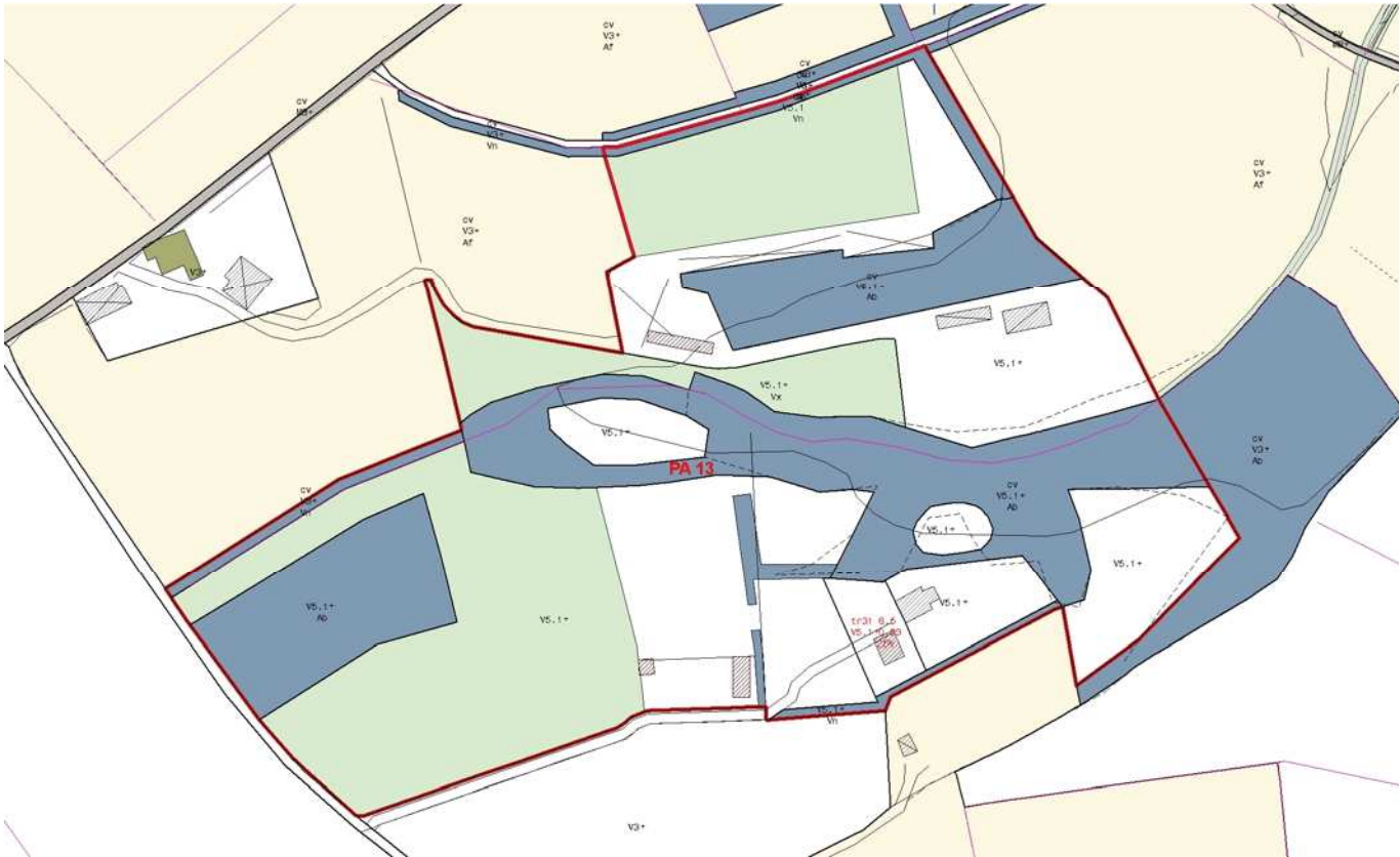
Piano Operativo: estratto Tavola "Usi del suolo e modalità d'intervento"