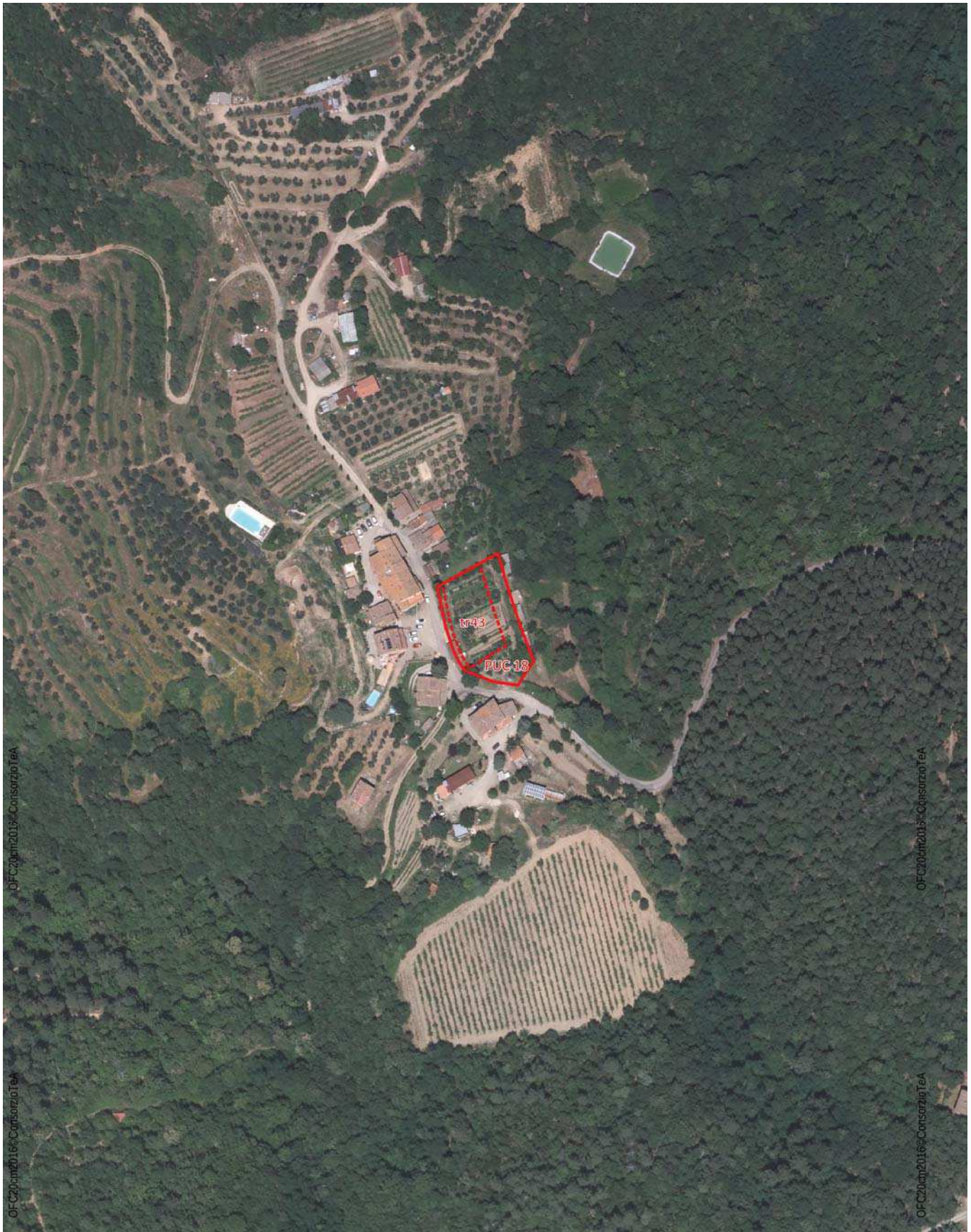
Ortofoto 2016 (Volo AGEA)