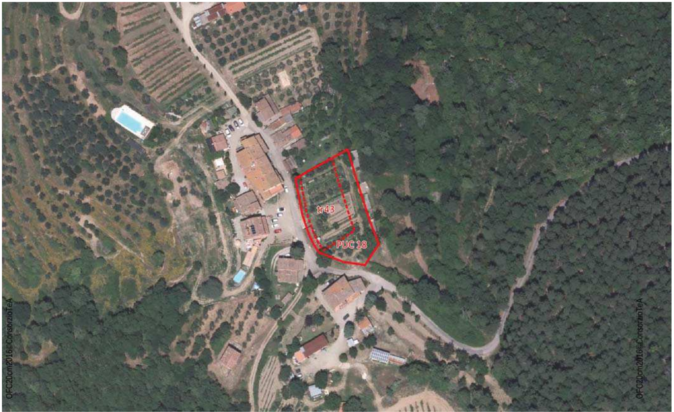
Ortofoto 2016 (Volo AGEA)